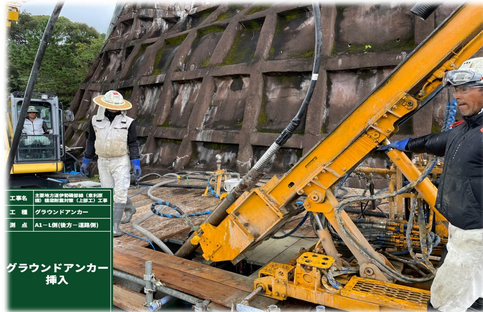
工事名 主要地方道伊勢磯部線(恵利原橋)橋梁耐震対策(上部工)工事 工種 グラウンドアンカー 測点 A1-L側(後方-道路側) グラウンドアンカー挿入

秋の日も過ぎ、漸く気温が落ち着いて、秋の気配が感じられますようになりました。現場は、令和6年4月より着手し概ね6ヶ月が経過しました。