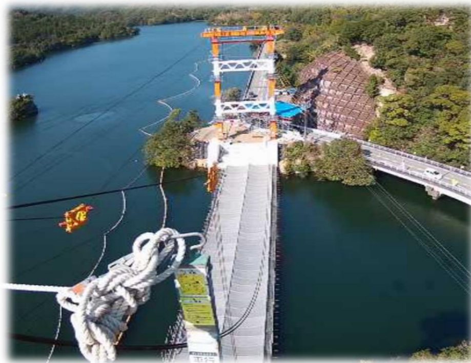
鉄塔頂部からの景色